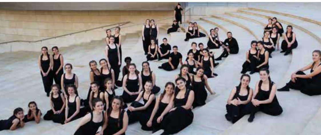
Leioa Kantika Korala

El coro ha ofrecido conciertos recientemente en Tenerife, Barcelona, Bordeaux o Toulouse y próximamente visitará Granada o Basilea entre otros destinos.