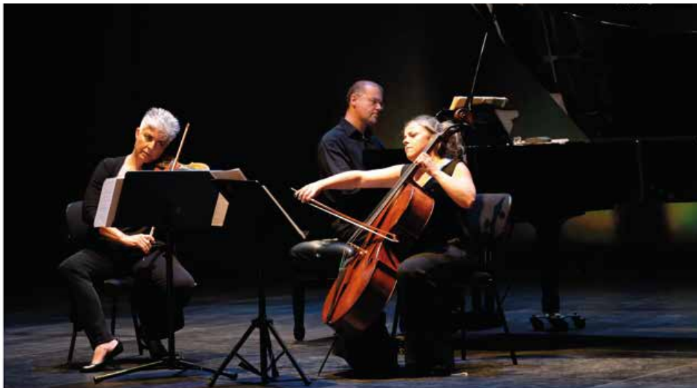
B3: Trío Brouwer

En su línea de acción más reciente ha estrenado la video ópera de cámara La Isla de la compositora Nuria Núñez Hierro. Apuesta por la interacción multidisciplinar (live painting, danza, teatro etc.) y promueve la investigación en el uso de las nuevas tecnologías aplicadas a la música (electrónica, video, sensores, sistemas de iluminación etc.)