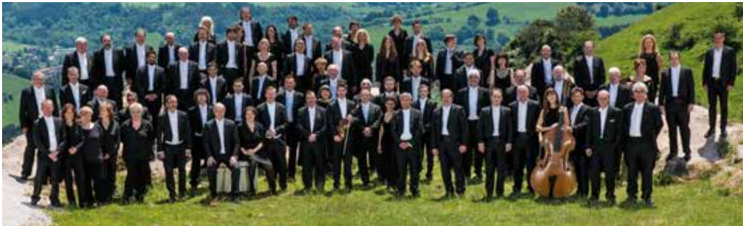
Bilbao Orkestra Sinfonikoa